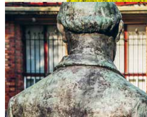
Le Musée Benoît-De-Puydt