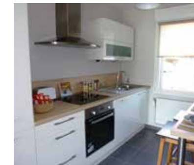
Exemples d'aménagements intérieurs.

Rendez-vous à Douges, rue de la Malterie pour une visite personnalisée de notre maison témoin décorée, sur simple appel.