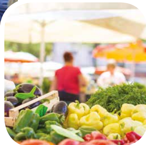
Le marché du Laboureur