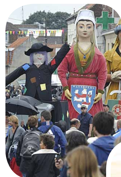
La fête des Berlouffes

A la lisière de la métropole lilloise et de la frontière belge , Watrelos dispose d'une situation géographique de premier choix. Riche de son histoire, avec une tradition de village, la ville séduit aujourd'hui de nombreuses entreprises ayant favorisé son développement économique . Une commune dynamique qui dispose de tous les équipements culturels et sportifs facilitant la vie de ses habitants. Ponctué de nombreux espaces verts, Watrelos est une ville attrayante et ressourçante où toutes les générations s'épanouissent en harmonie !