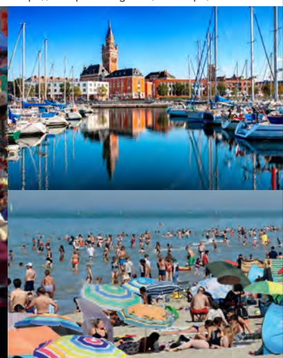
Le port / Ses architectures Le chantier naval